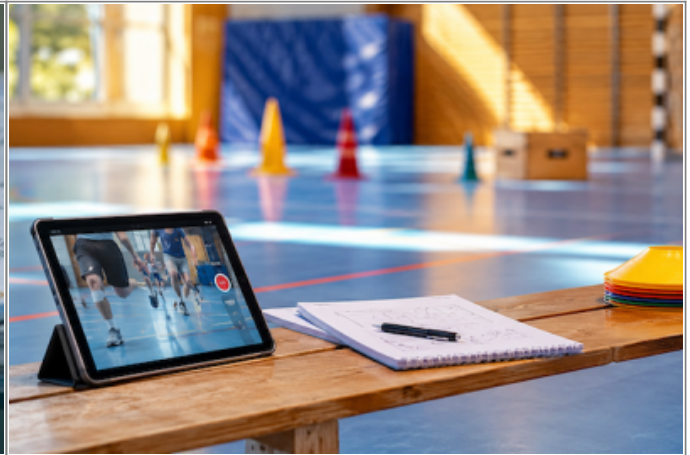
Informationen zum Probeunterricht eSession: Digitales Arbeiten im Sportunterricht