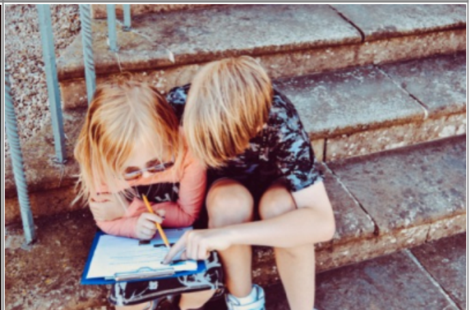
Lernen und Produktivität

Die Seiten dieses Wikis sind mit Schlagwörtern (Tags) versehen. Je größer ein Begriff in der Tagcloud erscheint, desto häufiger wurde das Schlagwort vergeben: